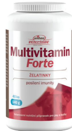
Artikel Nummer: 4500009

Zusammensetzung: Glukosesirup, Zucker, Schweinegelatine, Mischung aus Vitaminen und Mineralstoffen (L-Ascorbinsäure, DL-Alpha-tocopherolacetat, Zinkcitrat, Maltodextrin, Nicotinamid, D-Calciumpantothenat, Kyanocobalamin, Cholecalciferol, Pyridoxinhydrochlorid, Folsäure Säure, Kaliumjodid, Biotin), Säuren - Zitronensäure, Milchsäure, Apfelkonzentrat, Karottenkonzentrat, Hagebuttenkonzentrat, färbende Konzentrate (aus Spirulina, Karotte, Saflor), Invertzuckersirup, Farbstoffe - Carotine, Curcumin, Poliermittel - Carnaubawachs, Aromen, natürliche Aromen.