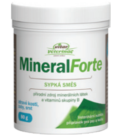
Artikel Nummer: 4500006

Zusammensetzung: Aquamin F (Meeres-Multimineralkomplex), Bierhefe (Mischung aus Vitaminen und Mineralstoffen).