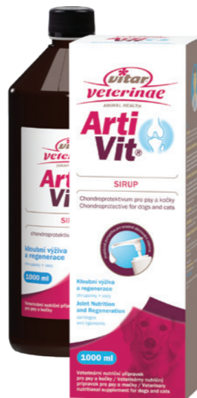
Artikel Nummer: 4500012