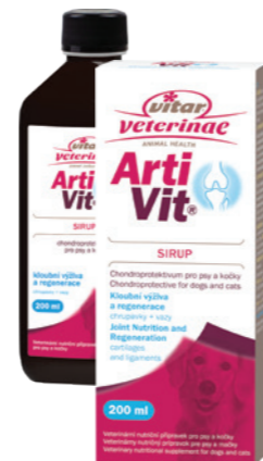
Artikel Nummer: 4500001

Zusammensetzung: Zucker, Wasser, hydrolysiertes Kollagen, Glucosaminsulfat.2KCl, MSM, Chondroitinsulfat, L-Ascorbinsäure (Vitamin C), Boswellia serrata-Extrakt, Hyaluronsäure, Konservierungsmittel – Kaliumsorbat.