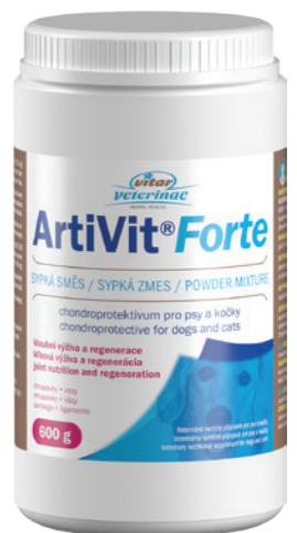
Artikel Nummer: 4500005