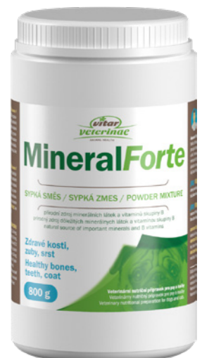
Artikel Nummer: 4500008