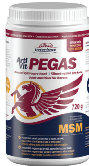
Artikel Nummer: 45000015

Zusammensetzung: MSM (methylsulphonylmethane).