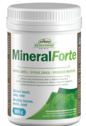
Artikel Nummer: 4500007