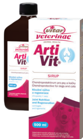
Artikel Nummer: 4500002