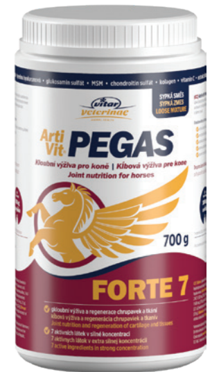
Artikel Nummer: 45000016

Zusammensetzung: Glucosaminsulfat.2KCl, MSM (Methylsulfonylmethan), Chondroitinsulfat, hydrolysiertes Kollagen, L-Ascorbinsäure, Boswellia serrata-Extrakt, Hyaluronsäure.