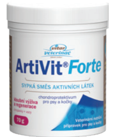
Artikel Nummer: 4500003

Zusammensetzung: hydrolysiertes Kollagen, Glucosaminsulfat.2KCl, MSM (Methylsulfonylmethan), Chondroitinsulfat, L-Ascorbinsäure, Boswellia serrata Extrakt, Hyaluronsäure.