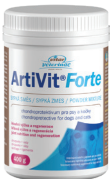
Artikel Nummer: 4500004